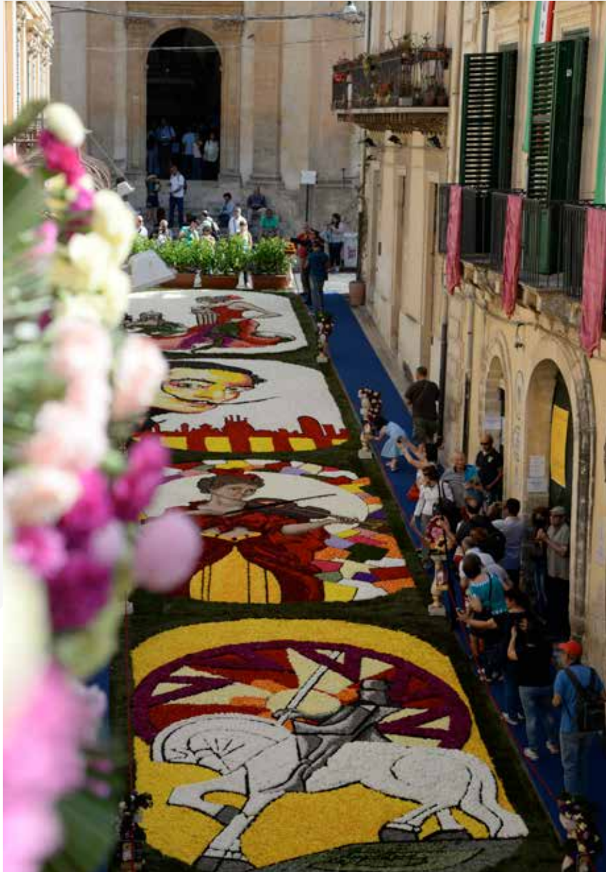
Infiorata di Noto ed. 2015, Via Nicolaci